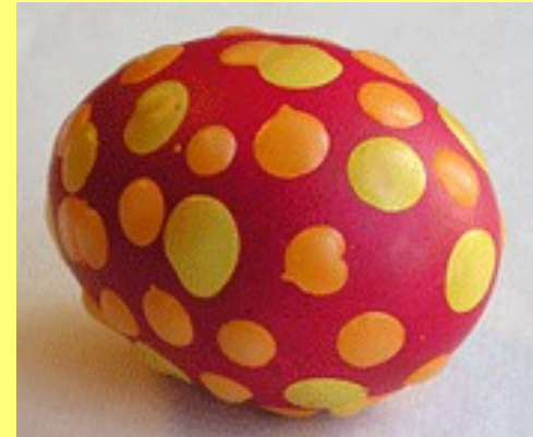
2. Окунули в оранжевую краску, ещё покапали воском.