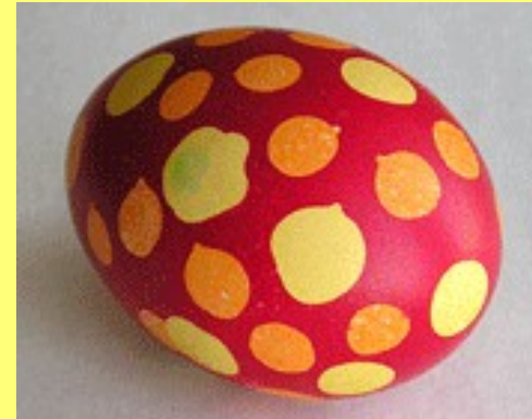
4. Вот такое забавное яйцо получается!