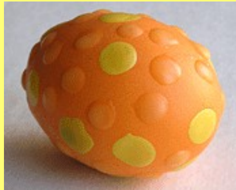
3. Покрасили в красный цвет. Осталось снять воск и натереть яйцо подсолнечным маслом.