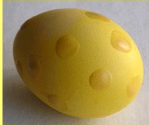
1. Покрасили яйцо в жёлтый цвет, нанесли капли воска.

Крапанки —сначала воском наносят на яйцо рисунок, а потом опускают в краситель. Яйцо красят в один цвет. Когда оно остынет и высохнет, на него капают горячим воском (например, с помощью горячей свечи). Теперь яйцо опускают в другой краситель, он должен быть не горячим, чтобы воск не расплавился. Эту процедуру можно повторить ещё раз, чтобы получить разноцветные пятна. Начинать красить лучше со светлых цветов. Например, желтый - оранжевый - красный. Если первые капли воска нанести на некрашеное яйцо, пятнышки будут белыми.