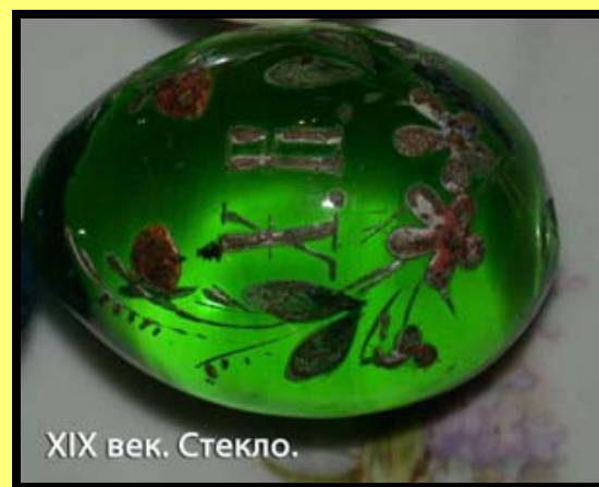
XIX век. Стекло.