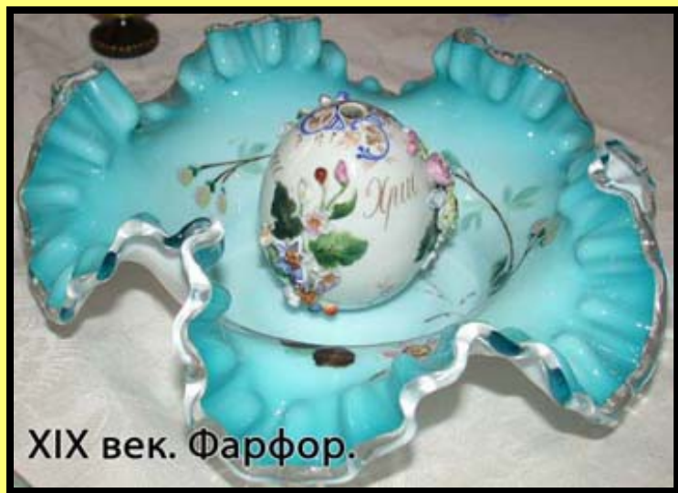
XIX век. Фарфор.